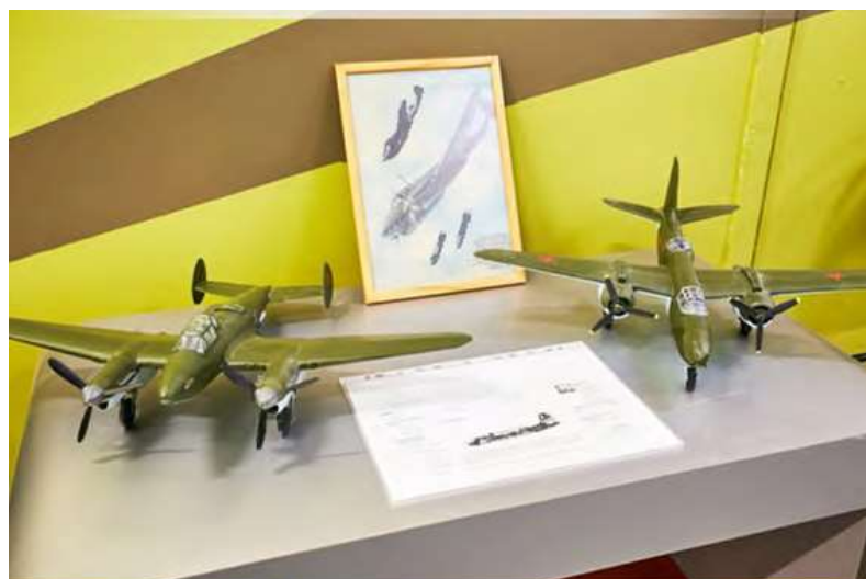
Работа детей: гидросамолёт МБР-2

Особое место в пополнении экспозиции Музея занимают, конечно же, модели самолетов. Они очень важны при проведении экскурсий. На каких самолетах воевали летчики в начале войны, почему такими большими были потери? И модель гидросамолета МБР-2, его тактико-технические данные отвечают на этот вопрос ( скорость- всего 250 км\ час, вооружение- 2 пулемета) Но, погибая в боях, их экипажи защищали Ленинград, не дали врагу захватить г.Волхов, оставить ленинградцев без электроэнергии. В 1943 г., базируясь на наших аэродромах «Приютино» и «Гражданка», 15-й ОРАП получил новые, современные самолеты ЯК-9, ПЕ-2, «Бостон» А-20 Ж. Модели этих самолетов в масштабе 1:33 сопровождают материалы о тех, кто на них воевал.